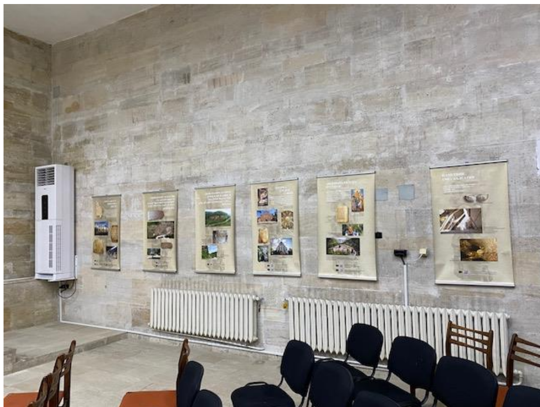
Сн. 12. Изложбата във Велики Преслав.