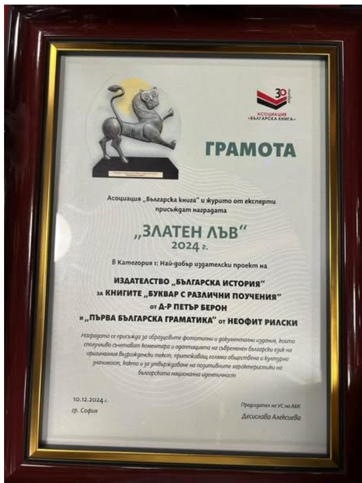
Сн. 13. Грамота „Златен лъв“ за най-добър издателски проект за 2024 г.