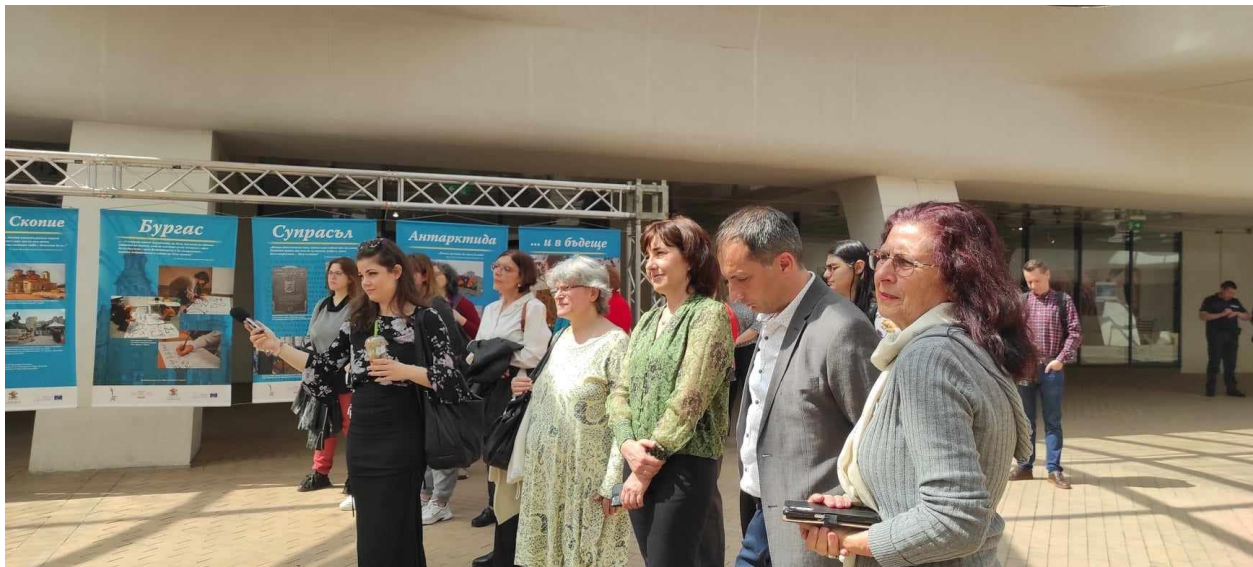
Сн. 11. Откриването на изложбата в Ларгото.