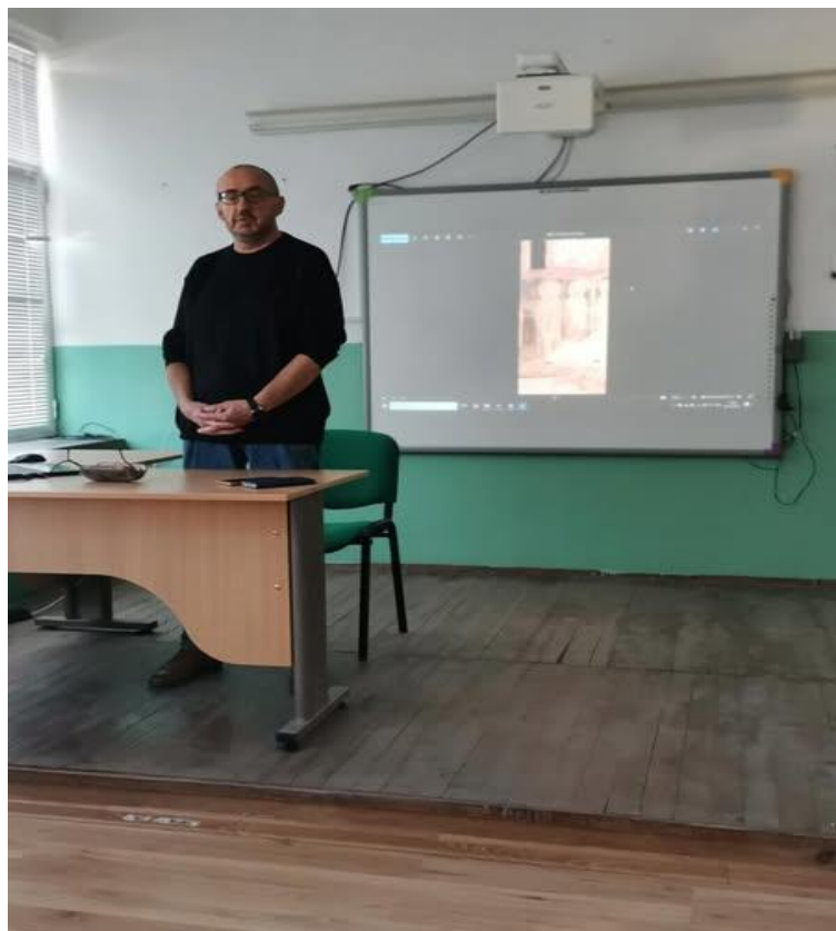
Сн. 7. Проф. дн Димо Чешмеджиев в училището в Симеоновград.

На 25. 11. 2024 г. проф. Димо Чешмеджиев гостува на учениците и учители от СУ „Св. Климент Охридски“ в Симеоновград и изнесе лекция за патрона на средното училище.