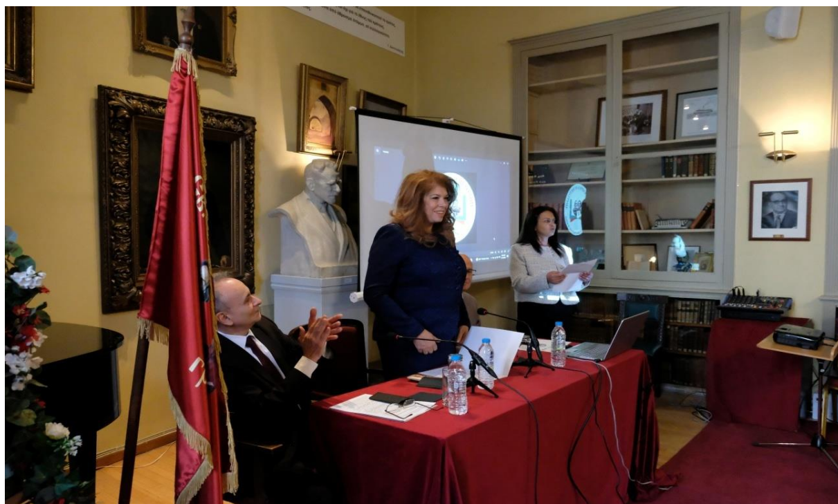
Сн. 4. Г-жа Илияна Йотова, вицепрезидент на Р България, открива конференцията.

Съвместно с ИБЕ–БАН, ПУ „Паисий Хилендарски“ и АБУЧ, КМНЦ бе организатор на международния научен форум „Пътят на светлината“ (11. 2024 г., Атина), посветен на делото на Кирил и Методий и техните ученици и последователи в България. Форумът се проведе под патронажа на вицепрезидента на Република България г-жа Илияна Йотова и с подкрепата на Посолството на Република България в Атина.