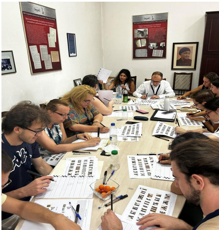
Сн.15. Лятна школа по славянска палеография в КМНЦ.