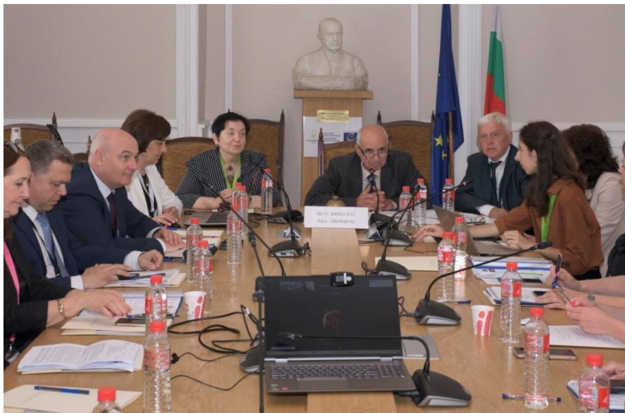
Сн. 1. Заседание на Генералната асамблея на асоциацията „Европейски културен маршрут за св. Кирил и Методий“.

наследството на отделни страни и култури в живо и споделено европейско наследство“. В словото беше посочено, че научната основа на всеки културен маршрут е необходимо условие за неговата автентичност и функционалност и бе отправена препоръка за по-голяма интернационализация на управлението на маршрута. В деловата част на заседанието беше представен отчетът на Асоциацията и бяха приети нови членове – Община Рим и Фондация „Аквилея“ от Италия и Супрасълската академия в Полша.